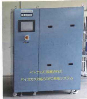
バイオガス対応 SOFC 発電システム