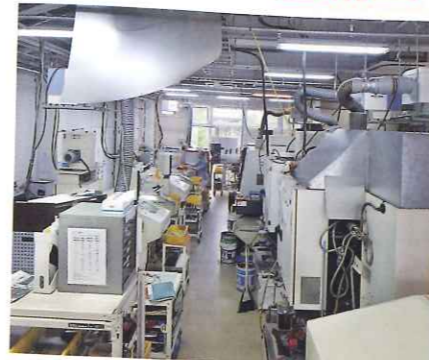
マシニングCライン