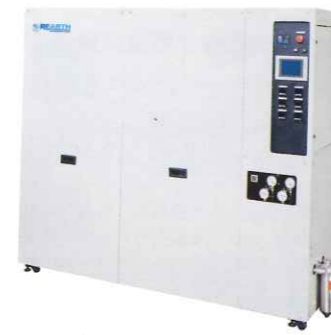
溶剤ガス回収装置 REARTH®S シリーズ