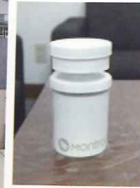
除菌消臭器 ZiaFree (ジアフリー)